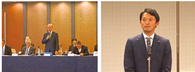
▲ 理事会であいさつを述べる小寺会長(左)、懇談会であいさつを述べる齋藤知事(右)

理事会終了後に県幹部・県議会自由民主党商工議員連盟との懇談会が開催され、齋藤知事、県議会自由民主党商工議員連盟 藤田会長はじめ、商工関係の県幹部や商工議員連盟の皆様にご出席いただいた。活発な意見交換が行われ、県政の両輪である県・県議会に対して、地域や小規模事業者が抱える課題、商工会の現状等を共有することができた。