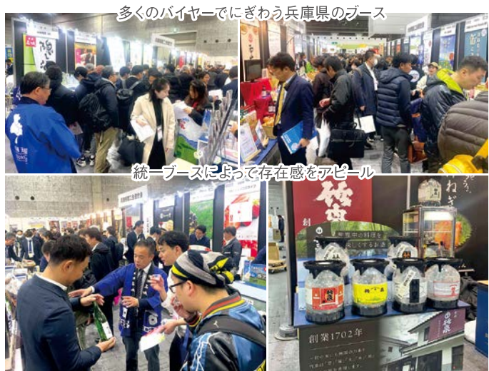
多くのバイヤーでにぎわう兵庫県のブース