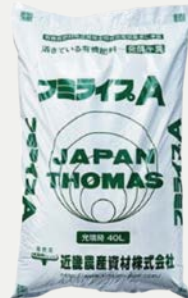
へ 牛糞の堆肥化により、循環型社会構築に貢献していると認められ、「ひょうご産業SDGs認証事業ゴールドステージ」を取得