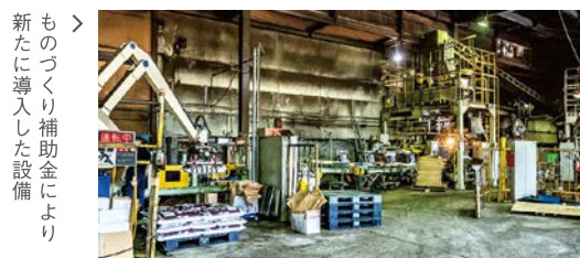
ものづくり補助金により新たに導入した設備

酒造メーカーから見れば廃棄物のリサイクルと処理費用の削減の一石二鳥で大幅な経営改善につながり、この取組は評判を呼び、すぐに他の酒造メーカーにも広がった。