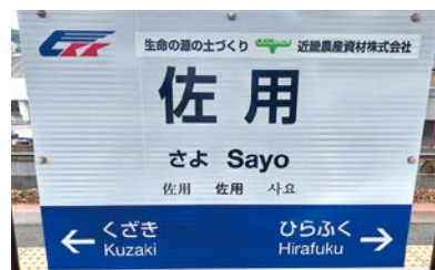
同社初のスポンサー契約の締結を果たした、智頭急行開業30周年を記念して開始した「駅名ネーミングライツ」事業

これらの事業に積極的に参画する理由について「従業員が当社で働くことに誇りを持てること、また地域内の若者がUターンで佐用町に戻ってくる際の職業の選択肢として当社が選ばれるように地域住民に対する当社のブランド化を図っていきたい。」という社長の思いがある。「有機堆肥の製造には、重機を用いるためまだまだ化石燃料に依存している。同認証事業ゴールドステージに認定された事業者として恥じないよう、5年後を目指して、化石燃料の使用量を低減し、電気を主とした有機堆肥を製造できる体制を整えていく。」と社長から今後の意気込みを聞くことができた。近畿農産資材株式会社の新たな挑戦は次のステージに進んでいる。