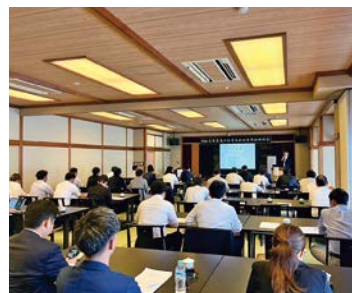
△ 田畑氏による講演の様子